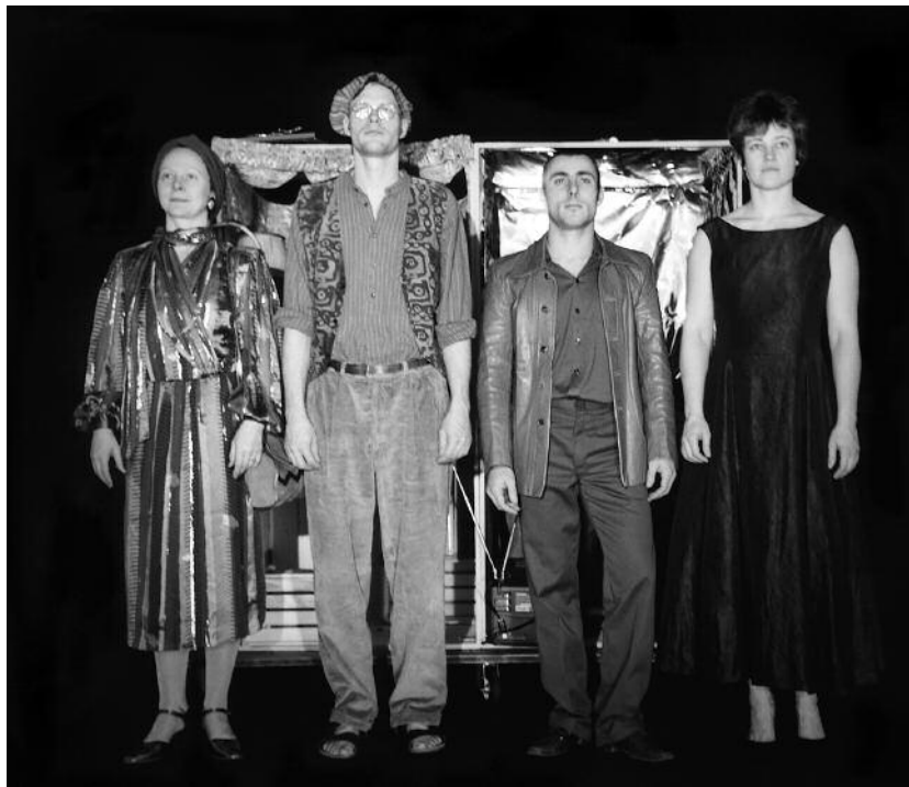
Compagnie Lynx. (29.9.)