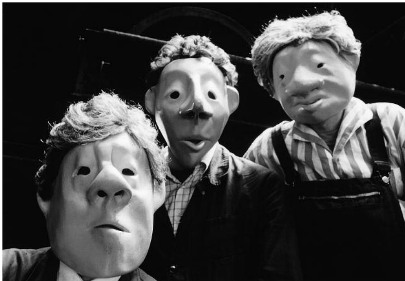
Die «Familie Flöz» aus Essen.

semble – Theater der Regionen» und den Kulturtätern.